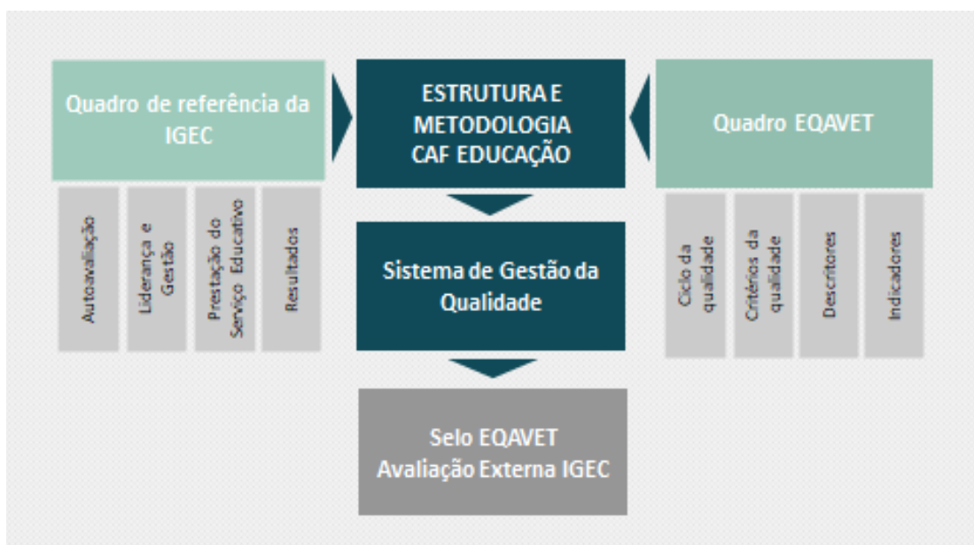
Figura 2 – Processo de alinhamento

No ano letivo transato, a EPADD criou um sistema alinhado com o Quadro EQAVET ( European Quality Assurance Reference Framework for Vocational Education and Training ) e com as orientações previstas nos normativos publicados no âmbito da Autonomia e Flexibilidade Curricular, Educação Inclusiva, Perfil dos Alunos à Saída da Escolaridade Obrigatória, o modelo de avaliação externa da IGEC (Inspeção Geral da Educação e Ciência) e os seus processos de autoavaliação (CAF e Observatório Pedagógico) e consequentes Planos de Ações de Melhoria (PAM) (Figura 2).